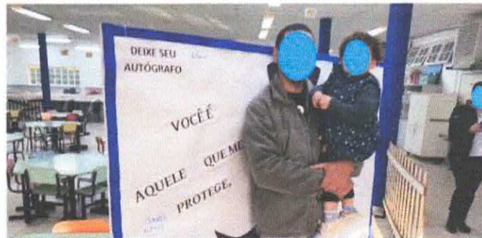
Homenagem ao dia dos murais. Mural interativo na entrada da escola.