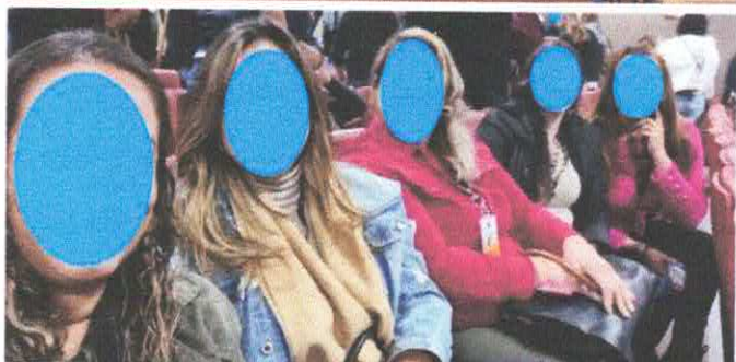
Equipe de diretoras da VAPI presentes no Seminário Educação + Inovação.