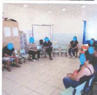
Reunião de pais realizada com a turma do Pré II. Foi realizado a entrega de Kits do Projeto Recupera e a diretora deu orientações referente ao direcionamento para o 1º ano.