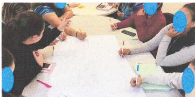
Profissionais durante a formação com foco no trabalho em equipe.