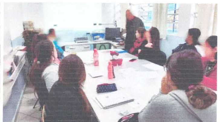
Formação com as auxiliares