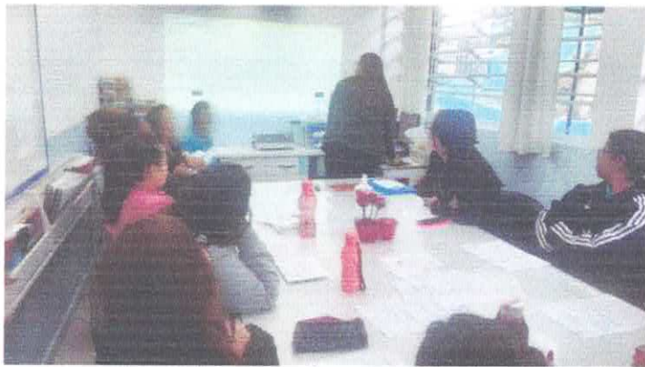
Formação em tfc com as auxiliares