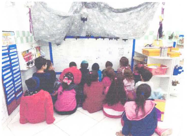
: Escuta das crianças