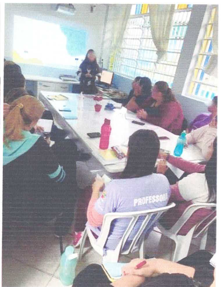
Palestra Psicopedagoga Ariane