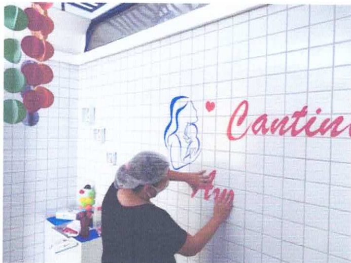
ORGANIZAÇÃO DO CANTINHO DA AMAMENTAÇÃO