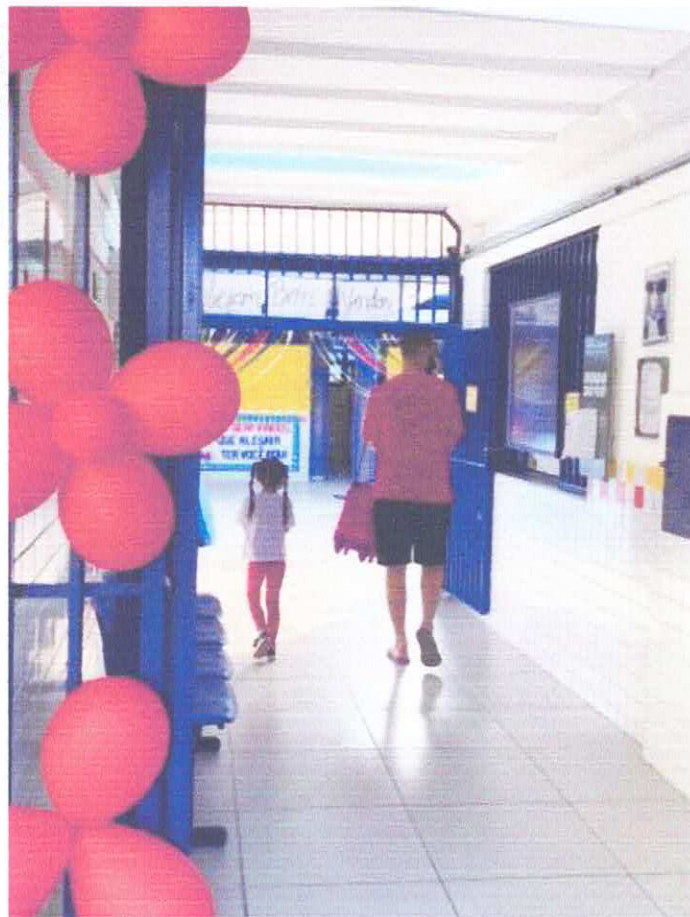
RETORNO ÀS AULAS - INÍCIO DO ANO LETIVO