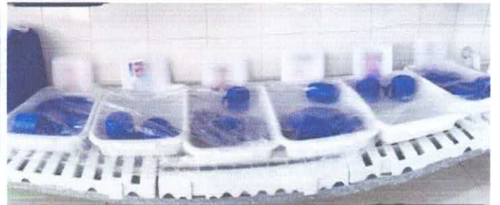
Crianças com conduta alimentar