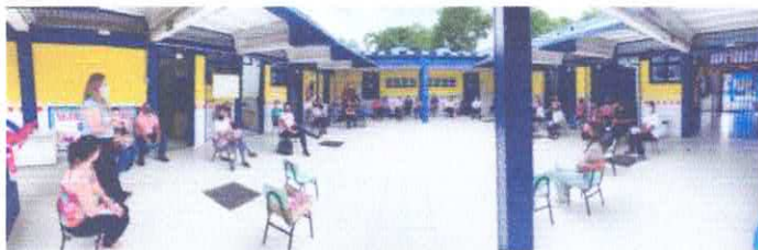
REUNIÃO DE ACOLHIDA DOS FUNCIONÁRIOS