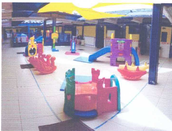
SEGUNDO PARQUE NOVO DAS CRIANÇAS BEM PEQUENAS E BEBÊS