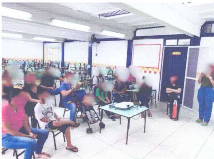
Reunião de pais novos