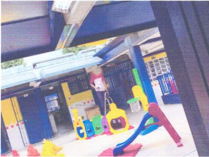
Construção dos parque novos