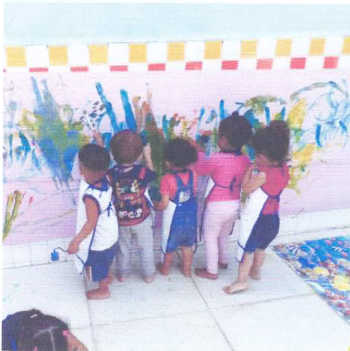
PERÍODO DE ADAPTAÇÃO