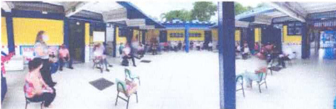
Acolhida dos funcionários