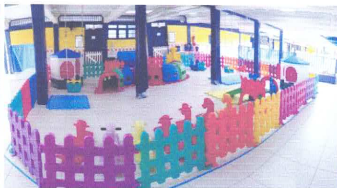
NOVO PARQUE DOS BEBÊS E CRIANÇAS BEM PEQUENAS