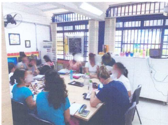
TFC - Trabalho de Formação Continuada