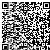
SUSI TIEMI STABILE KONDO ESCRITURÁRIA (O) Matricula: 15719

A veracidade do documento pode ser conferida no site https://servicos.sjc.sp.gov.br/ConsultaAssinaturaContrato/Consulta.aspx?p=42220&a2020&c5794 ou informando os seguintes dados: N Processo: 42220 Ano: 2020 Identificador: 5794