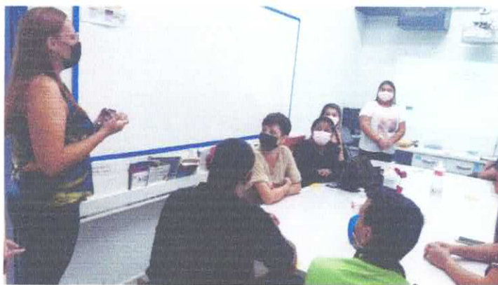
Reunião de pais.