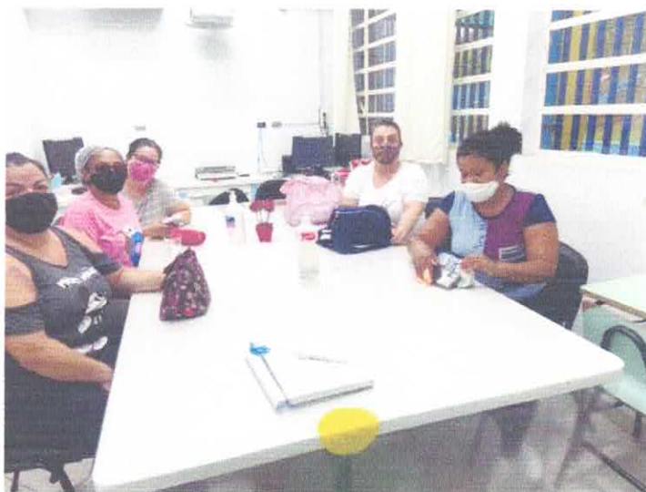
Formação com a equipe de cozinha.