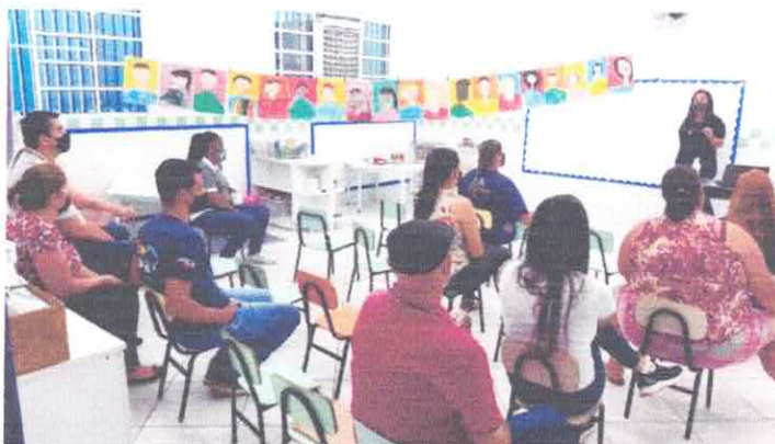
Reunião de pais.