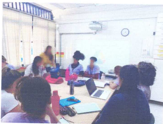
FORMAÇÃO SOBRE O USO DA TECNOLOGIA