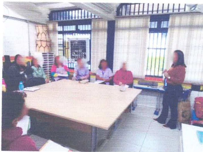
TFC ESPECÍFICO - INCLUSÃO