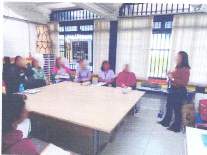
FORMAÇÃO ESPECÍFICA - CRIANÇA COM DEFICIÊNCIA E INCLUSÃO ESCOLAR