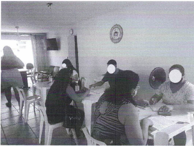
entrega e conferência dos documentos para contratação na sede VAPI