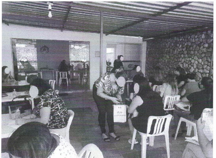
processo seletivo realizado na sede VAPI